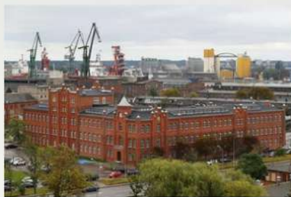
Kolacja dla Wykładowców